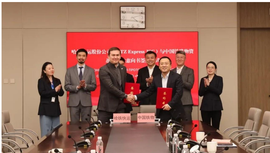
2024年1月19日，KTZ Express 与中国铁物就集装箱班列运输项目签署战略合作意向书 官网： https://ktze.kz/

跨里海运输路线： 由土耳其伊斯坦布尔发车，途经安卡拉至阿塞拜疆巴库港，由滚装船运至哈萨克斯坦阿克套港，之后通过哈境内约3200公里铁路线路，由哈中边境阿腾科里-霍尔果斯口岸入境中国。线路全长8693公里，装载42个集装箱，全程运行时间仅为12天。